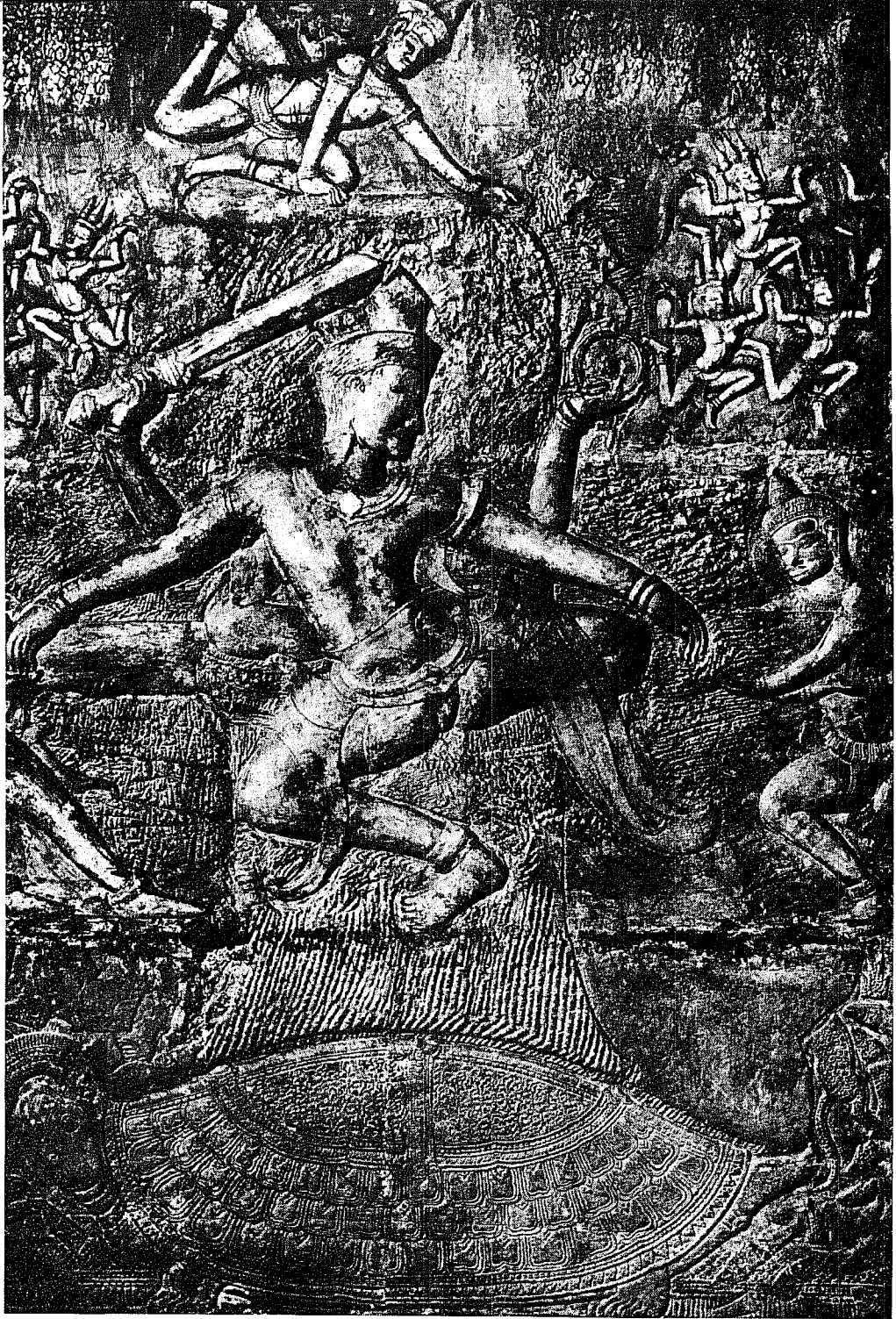
Les dieux et les démons réunis ont baratté la mer, sous la direction de Vishnou, pour obtenir la liqueur d'immortalité. Celle-ci est apportée par le médecin Dhavantari qui sort des flots à la fin du barattage. Bas-relief d'Angkor-vat, 1113 avant J.-C.