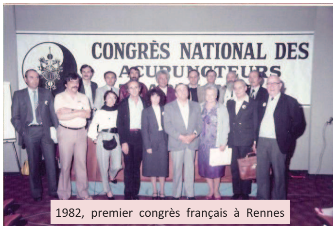
1982, premier congrès français à Rennes